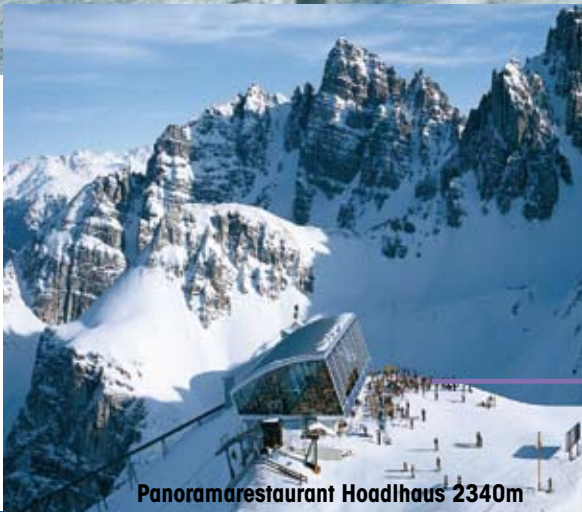
Panoramarestaurant Hoadlhaus 2340m