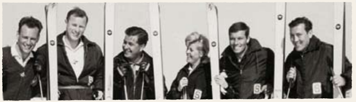
Skilehrer damals und heute