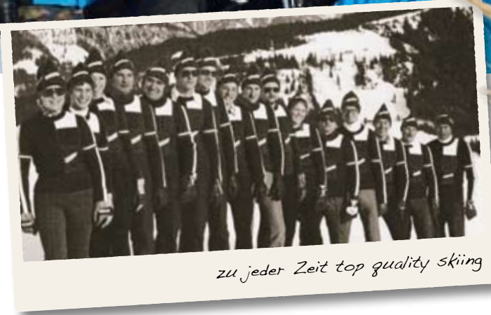
zu jeder Zeit top quality skiing