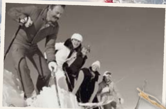
Von der Kurzskimethode zu ski in 2 days